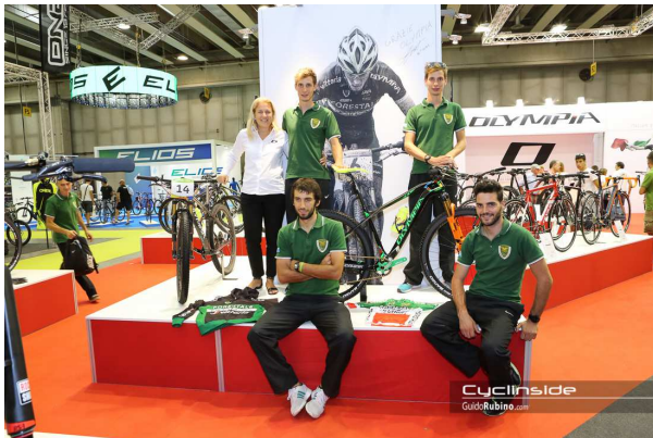
Biciclette ed anche campioni presenti in fiera