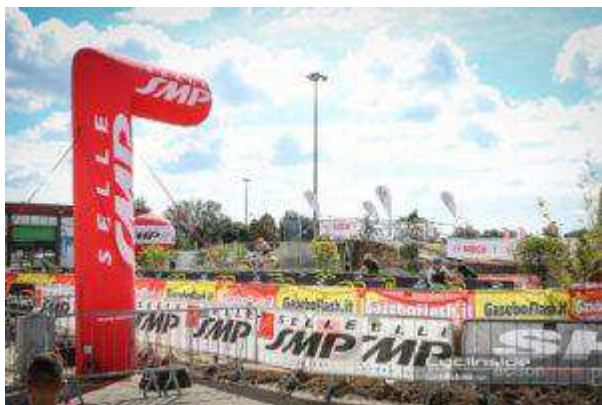
La zona test