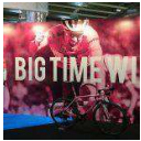
Shimano e Giant