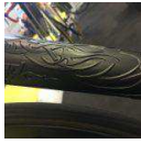
T red, Manaia FA