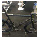
T red, Manaia FA