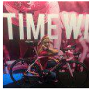
Shimano e Giant