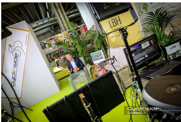
Maurizio Fondriest nel nostro stand in diretta TV

Poi ci sono stati i campioni e i personaggi del ciclismo attuale e della storia: da Aru a Fondriest, Chiappucci, ma anche Gimondi e Moser, poi Cipollini e i campioni della mountain bike. Alcuni sono anche passati per il nostro stand, realizzato insieme a Viagginbici.com con il set televisivo di TgCom24 e le interviste di Ludovica Casellati e la curiosità dei tanti avventori.